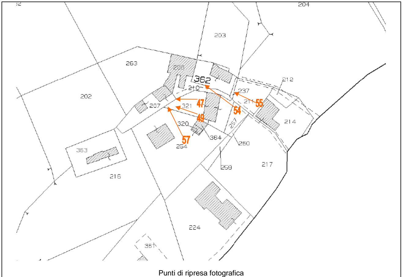
Punti di ripresa fotografica